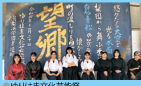
●ゆりはま文化芸能祭