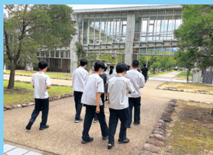
●キャンパスツアー