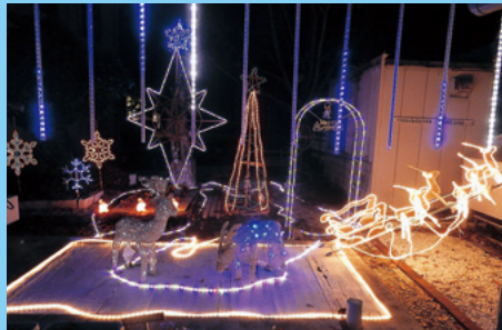
●イルミネーション