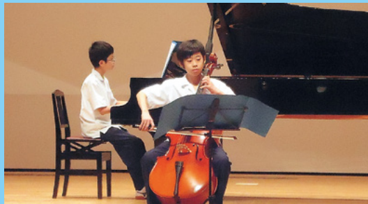
●湯梨浜学園音楽会