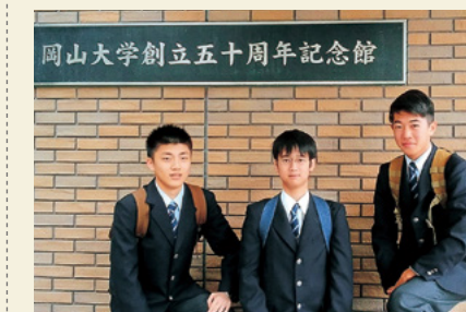
大学キャンパスツアー